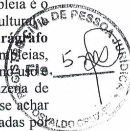
Tabela de Notas - Osvaldo Cruz - SP Rua Kieffer, 300 - F: (18) 3528-3728

AUTENTICAÇÃO Autentico a presente cópia reprográfica com original a mim apresentado do que dou fé.